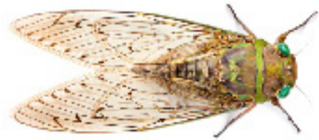
Figura 1: “Cigarra o chicharra” (ZP_Cicada from Borneo_© photographer Alex Hyde)

tridulatorio para la cual se asocia el “canto” con la muerte del insecto: “Yo soy el único ser que nació para cantar y que muere cantando”. La demostración de la muerte de una chicharra por el “canto”, es argumentada frecuentemente por la presencia en los árboles de partes tegumentarias, llamada técnicamente exuvia, que no debe asociarse al “canto” de estos insectos, es decir, que el intenso “cantar” no produce el rompimiento del exosqueleto del invertebrado ni la consecuente muerte. En realidad, se trata de la muda del tegumento (Figura 2) que presentan algunos hexápodos en su vida larvaria, ninfal o pupal hasta alcanzar su estado adulto (Ramírez, 2012). En cuanto al “canto”, sin entrar en mayores detalles, es el sonido estridente y monótono, producido por los machos, para atraer a las hembras (Ramírez, 2012).