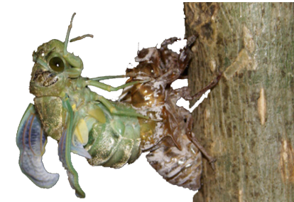
Figura 2: “Chicharra o cigarra” en proceso de muda (Metamorfosis www.fotonat.org )

Para el caso del personaje entomológico Cerbatana (Figura 3), ubicada en la Categoría II, en el cuento “La Cerbatana” de José Rafael Pocaterra, el insecto aparece de manera esporádica en el relato para recrear situaciones que son determinantes en la trama central, no participa en diálogo y es presentado, en éste caso, en un triple sentido de apreciación: como un ser de poca valía por uno de los personajes: “Un insecto verde, desairado, extravagante. Era un bicho verdísimo, ridículo, que traté de aplastar con un servilletazo”, o de cierta prestancia según la interpretación: “... ¡es un hermoso ejemplar!”, según otro personaje en el cuento. En éste relato, el personaje entomológico es asimilado a una situación en la que, dada su condición natural depredadora, se le asocia a la conducta descrita en el cuento con personas del género femenino: “- Y su crueldad sólo es comparable, en la vida reproductiva a la de ciertas mujeres...”