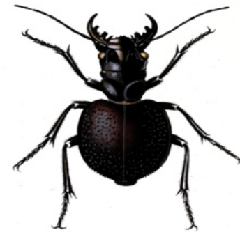
Figura 4: Coleóptero “mantícora”